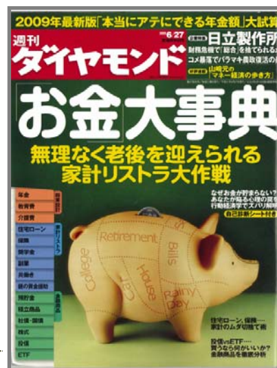
▲週刊ダイヤモンド