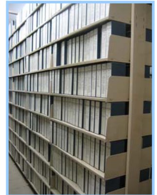
▲営業報告書(マイクロフィルム)