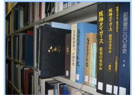
▲社史の所蔵は1万冊を超えます!

この他、日本の主要多国籍企業に関する基礎データを収録した「多国籍企業データベース」や「多国籍企業系譜図」、企業刊行の会社案内、営業報告書等を収録した「企業資料データベース」をセンターHP上で公開・提供しています。