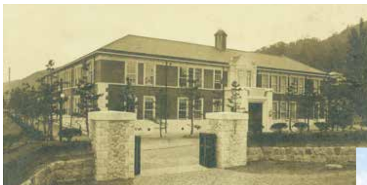
1921年(大正10年)頃の 神戸高等商業学校商業研究所 (兼松記念館(旧館))