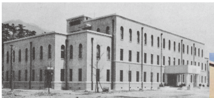
1934年(昭和9年)神戸商業大学商業研究所 (兼松記念館竣工時)