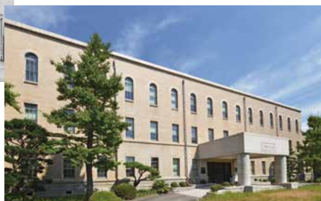
2016年(平成28年)神戸大学経済経営研究所 (兼松記念館)