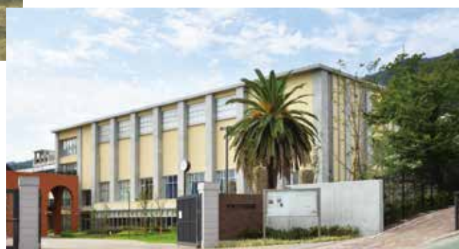
2016年(平成28年)神戸高等商業学校商業研究所跡地 (現 神戸市立葺合高等学校)